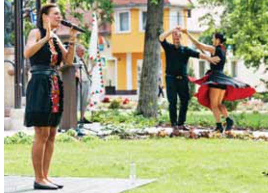
Kiss Kata Zenekar