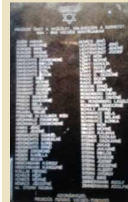
A zsidótemetőben a holokauszt emlékmű