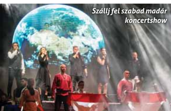
Szállj fel szabad madár koncertshow

Az ünnepség délelőtt 10 órakor kezdődött a Himnusz közös eléneklésével – amit a négyszeres fesztiváldíjas Vecsési Hagyományörző Zeneegyesület Fúvószenekara kísért – majd a Balla Péter Népdalkör zenés mű-