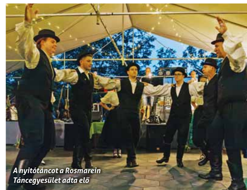
A nyitótáncot a Rosmarein Táncegyesület adta elő