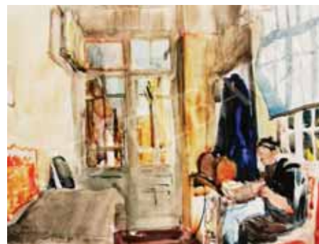
Szabados Jenő festménye: Anyám a verandán (1941)

Magyar orvosnő duplán is első mi, kirtartásának köszönhető. Sokat küszködött, oly nemes a tett, az orvosnőknek úttörője lett!