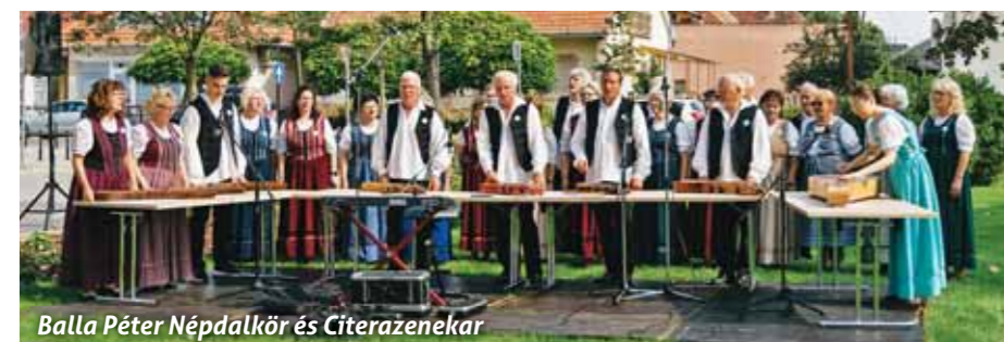
Balla Péter Népdalkör és Citerazenekar