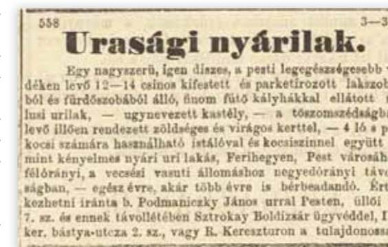
1876-os hirdetés a Pesti Naplóban