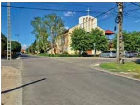
Önkormányzati beruházásban újították fel az Iskola utcát

A teljes út elkészült az önkormányzat támogatásából, a GEOCOR Kft. kivitelezésében, 161 millió forint értékben.