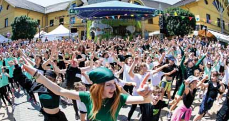
Idén is professzionális tánccbemutatóval nyílt meg a rendezvény