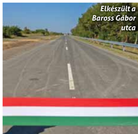
Elkészült a Baross Gábor utca