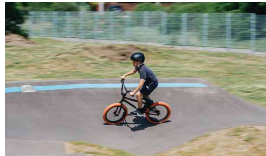
A hullámokból és kanyarokból álló pályán úgynevezett pumpáló testmozgással, pedálozás nélkül lehet haladni

A képviselő-testület még 2023. januárban döntött arról, hogy ismét elindul az Aktív Magyarország Országos Bringapark Program pályázatán. Egy évvel ezelőtt szintén pályáztak, de az akkor fiaskóval zárult. Ezúttal a benyújtott pályázat sikeres volt, és május 11-én megtörtént a pálya ünnepélyes átadása.