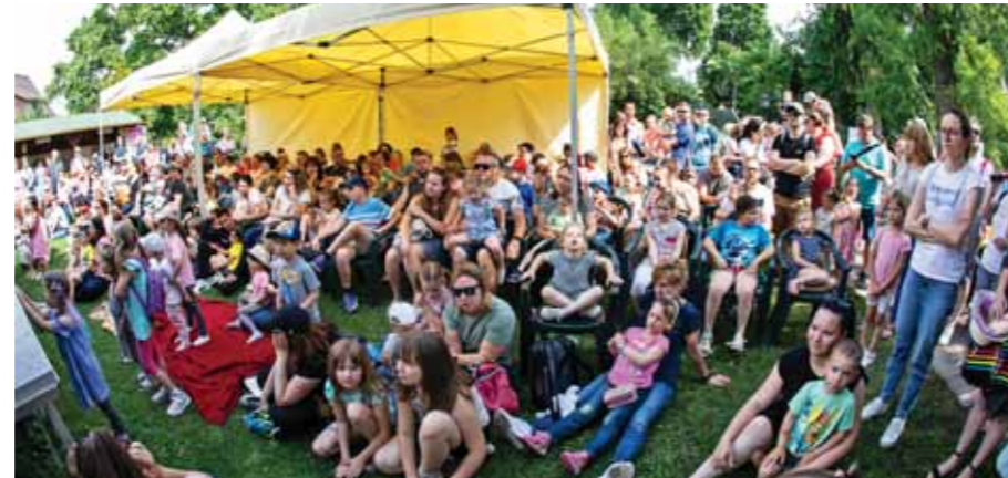
Sokan érdeklődtek a Bálint Ágnes Emlékház programjai iránt