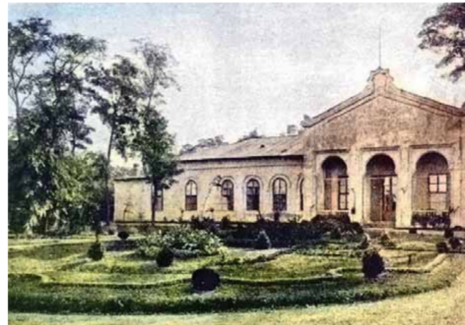
A kastély a XX. század elején (Kertészeti Lapok, 1906)

A vecsési 48-asokról szóló nyomozásaim közben újra meg újra beleszaladok a ferihegyi kastélyba. Beszélgetések közben, ha megemlítem a kastélyt, szinte mindig visszakérdeznak. Ferihegyen volt kastély? Igen. Majdnem száz éven át.