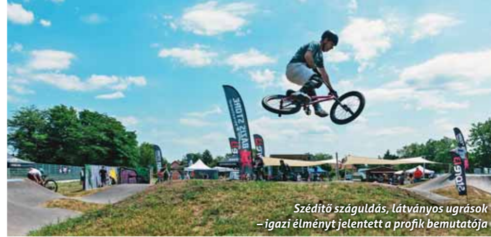
Szédítő száguldás, látványos ugrások – igazi élményt jelentett a profik bemutatója