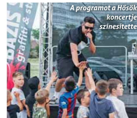
A programot a Hősök koncertje színesítette