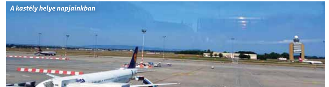
A kastély helye napjainkban

A kastély a szabadságharc alatt épült fel, és három alkalommal segített a harcok alatt a menekülőkn. Először 1849