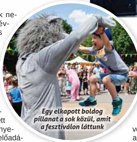
Egy elkapott boldog pillanat a sok közül, amit a fesztiválon láttunk

Azt gondolnánk nehéz minden évben újabb és jobb attrakciókat elhozni a rendezvényre, ám a lelkes szervezőknek hála, az évről-évre visszalátogatók is találtak maguknak két napra elég elfoglaltságot. A városháza előtt frissen telepített puha, zöld gyepszőnyegen hentelegni, bábelőadásokat hallgatni, felnőtteket is lekötő népi játékokon játszani, fogócskázni, koncerteken csápolni, finom falatokat harapni, erről és még sokkal