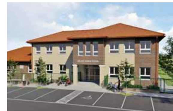
Az új óvodaépület látványterve