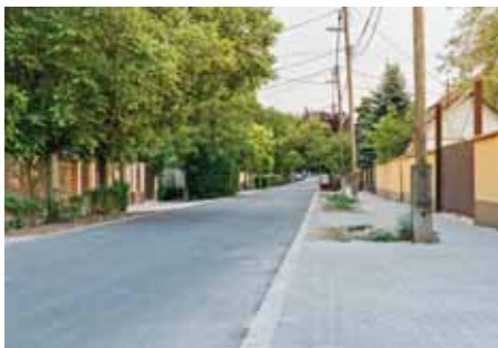
Teljes hosszában megújult a Vörösmarty utca

Mind a két utcán az úttest elkészült a GEOCOR Kft. kivitelezésében, az önkormányzat finanszírozta 85-85 millió forint értékben.