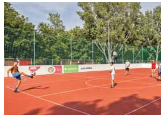
Megújult a lakótelepi sportpálya