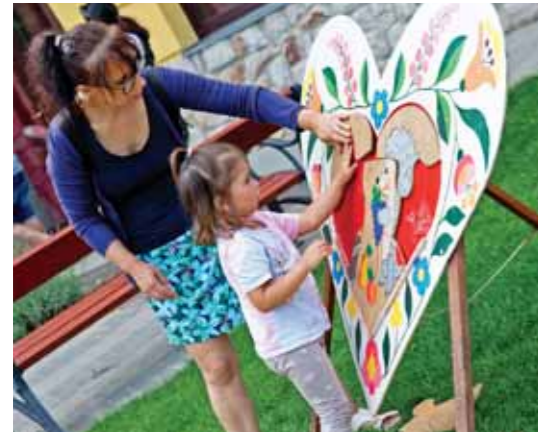
Sok-sok klassz fejlesztőjáték várta a kisebbeket