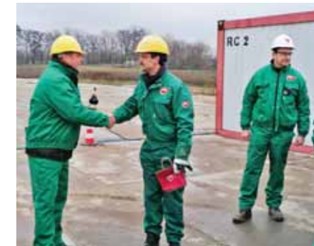
Újabb vecsési olajkutat állított termelésbe a MOL