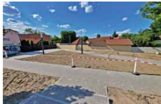
Parkosítják a kertekaljai vasúti megálló környezetét

Április végén elkezdődött a régi Kertekaljai állomás épület területének rendezése. A MÁV-val történő hosszas egyeztetések sikerrel jártak, végre eltűnhet ez csúfságos tér és egy kis parkkal szépülhet meg a terület. A Geocor Kft. kivitelezésében a megállóhely peron melletti részén az átjárótól a Nyafai Büféig térkö-burkolatra cserélik az elöregedett aszfaltot, rendezik a zöldfelületet, illetve néhány padot, szemetest és kerékpártárolót, is elhelyeznek a területen. Hangulatos térvilágítás is lesz, ami elősegíti a térfelügyelő kamerák hatékony munkáját, mivel ezt is telepítenek. Átadása májusban várható.