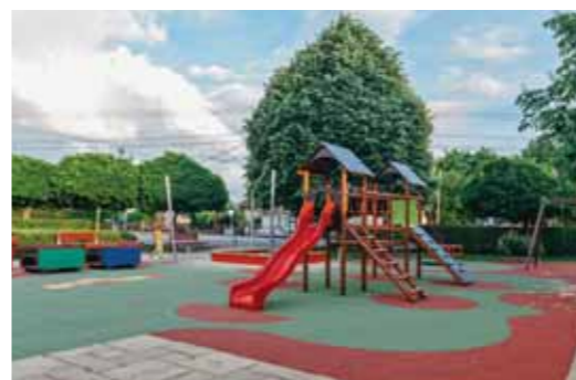
Felújították az Anna utcai játszótérrel