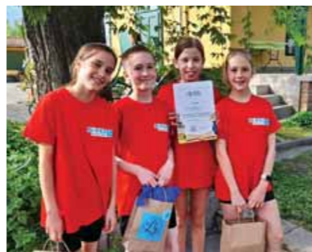
Bölcs Bagoly csapat

A városi Vers- és prózamondó verseny en is sok szép helyezéssel gazdagodtak tanulónk, az ő névsorukat az előző lapszámából már megismerhettük.