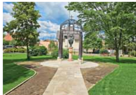
A Szent István téri munkálatok során az emlékműveket is felújítják

A műemlékek felújítása egy külön megrendelt munka volt, annak összege nem szerepel ebben a tételben.