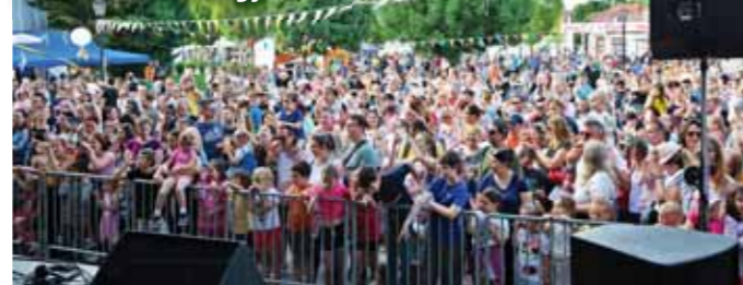
Vasárnap az Alma együttes koncertje zárta a fesztivált

A nagyszínpad előtt együtt bulizott kicsi és nagy