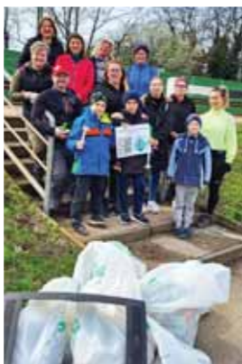
Tavaszi szemétszedő akciót szerveztek a vecsési környezetvédők

– Egyesületünknek minden forint támogatás számít, ezért arra kérjük a vecsési lakosokat, amennyiben hasznosnak ítélik a munkánkat, adjuk 1 százalékának felajánlásával idén is támogassák a Kispatak Természetvédő Egyesületet. (További információért keresse a Kispatak Természetvédő Egyesület és Hulladékkommandó Facebook-oldalát .) varga