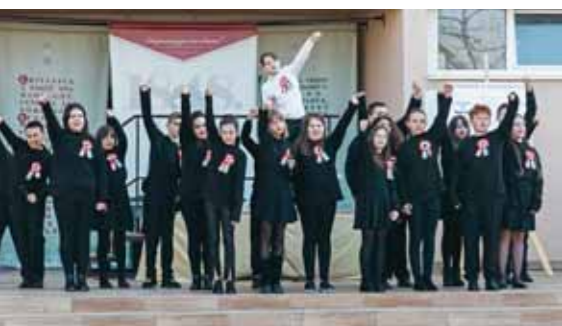
„Talpra magyar, hí a haza!”