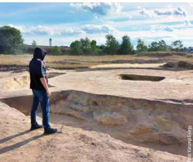
Az egyik jellegzetes szarmata ároknál