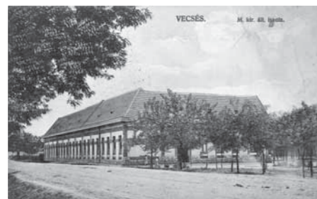
Egykor iskola volt a Fő utca 40. szám alatt, ma üresen tábongó autószalon áll a helyén