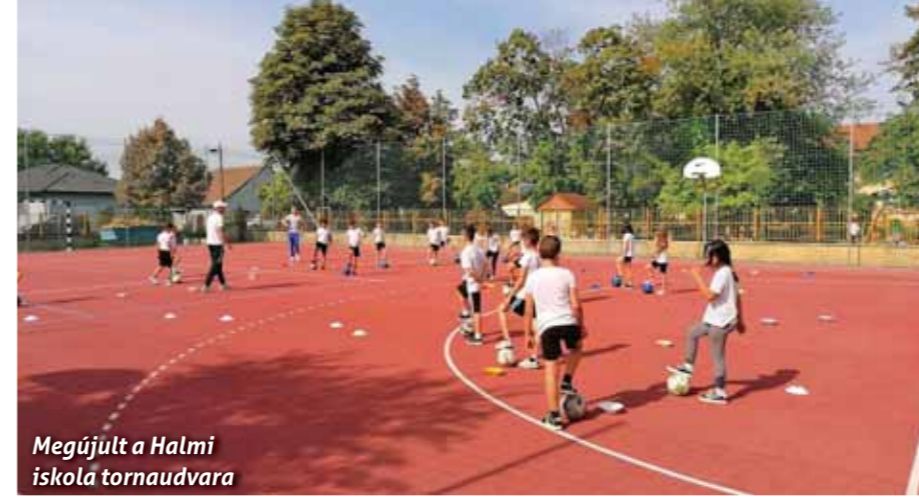
Megújult a Halmi iskola tornaudvára