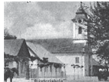
Kántoriskola a Fő utca-Iskola utca sarkán