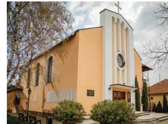
Megújult a Szent Kereszt templom

A tetőfedés teljes cseréje is a megtörtént, a felújítás összegét, 16,3 millió forintot az iskola saját költségvetéséből biztosította.