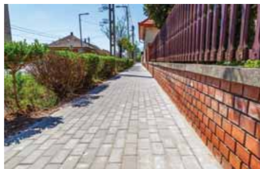
Városszerte folytatódott az önkormányzat járdaépítési programja