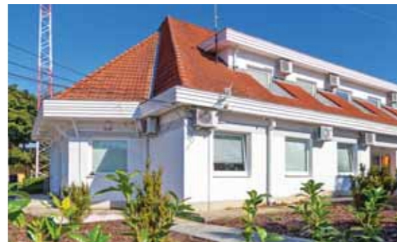
Az önkormányzat megvásárolta a Tigáz egykori irodáját. A felújítás után 2021-ben a családsegítő központot helyezték el az épületben

Az év bevételi és kiadási főösszege 6 024 702 449 forint. Májusban a 2020. évre vonatkozó zárszámadást követően költségvetési maradványként 2,8 milliárd forint mutatkozott, melyből 2,1 milliárd forint feladattal terhelt; azaz 700 millió forint volt a szabadon felhasználható összeg.