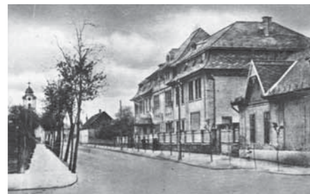
Az 1927-ben felavatott Kultúrházban kápolna és mozi is volt

Sajnos, a végeredmény szempontjából mindegy, hogy milyen módon pusztultak el ezek a patinás középületek.