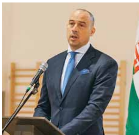
Schmidt Ádám sportértfelelős államtitkár: a sportinfrastruktúra-fejlesztési program által olyan helyszínek jönnek létre országsszerte, melyek motivációt jelenthetnek a sportolásra a fiatalok számára is

lis, gazdaságossági és üzemeltethetőségi szempontból is a lehető legjobb minőséget adják a településeknek. Az üzemeltetéssel kapcsolatban kiemelte, hogy olyan energetikai megoldásokat alkalmaztak, amelyek eredményeként közel nulla energiaigénnyel üzemeltethető az épület. Elmondta, hogy a létesítmény több mint 2 milliárd forint költségvetésből valósult meg, reményei szerint minden forint azt a vecsési jövőépítést és az egészséges életmódot szolgálja, amiért ez a létesítmény létrejött.