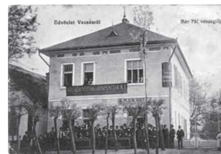
Már vendéglő épülete. Az emeleten Néptakarékpénztár működött