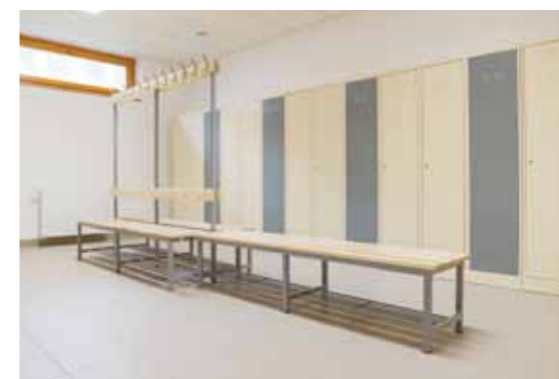
A csarnok egyik öltözője

Szlahó Csaba polgármester Vecsés egyik legdinamikusabban fejlődő városrészének nevezte a Halmi telepet, ahol számos fontos beruházás valósult meg az elmúlt években.