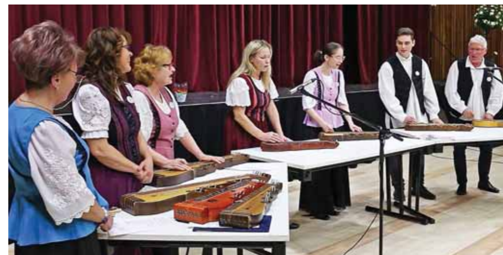
A népdalkör citerazenekara is műsorral kedveskedett a vendégeknek

A Balla Péter Népdalkör Hagyományőrző Egyesület február 17-én, 14 órától tartotta hagyományos évzáró-évnyitó és születésnapi rendezvényét a Bálint Ágnes Kulturális Központban.