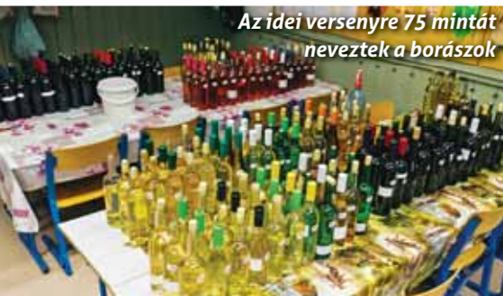
Az idei versenyre 75 mintát neveztek a borászok