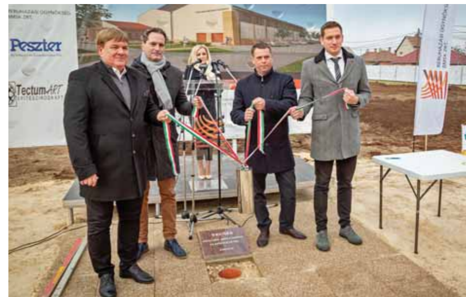
Letették a kézilabda munkacsarnok alapkövét

Kivitelező a székesfehérvári Peszter Ingatlanforgalmazási, Építőipari és Kereskedelmi Kft. A beruházásokat a BMSK Beruházási, Műszaki Fejlesztési, Sportüzemeltetési és Közbeszerzési Zrt. bonyolítja le.