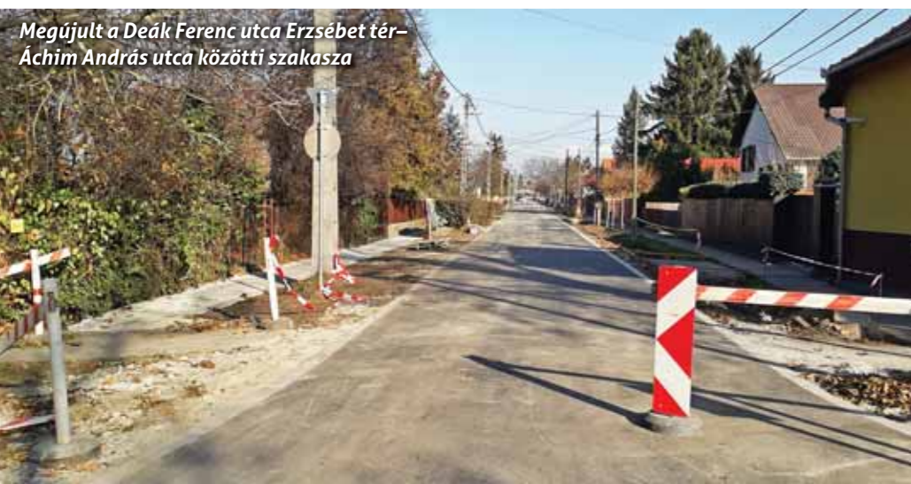
Megújult a Deák Ferenc utca Erzsébet tér-Áchim András utca közötti szakasza