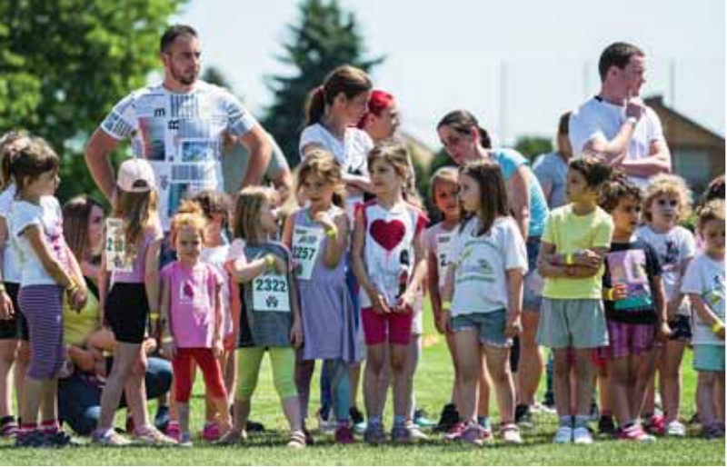
Rajtra várnak a legkisebbek