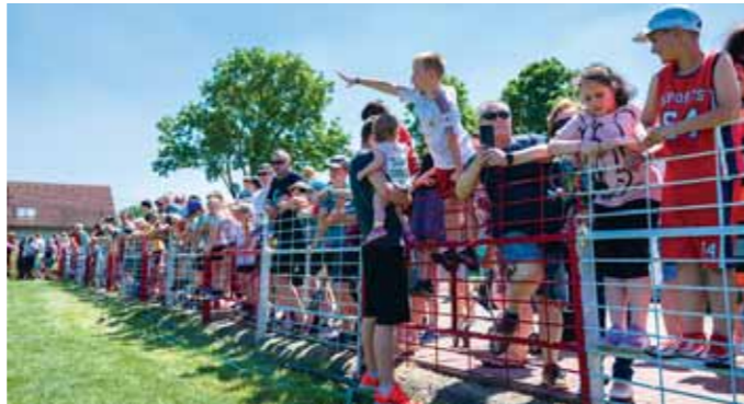
Szurkolók is szép számmal érkeztek a 28. Lóti-Futira