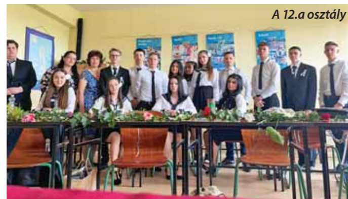
A 12.a osztály

Két év kihagyás után végre ismét a hagyományos ballagással búcsúztattuk el végzős gimnazistáinkat. Déli 12 órakor a két osztály tanulói meghatottan gyülekeztek gyönyörűen feldíszített tantermeikben, hogy részt vegyenek az utolsó osztályfőnöki órán, meghallgassák osztályfőnökeik búcsúzó szavait és utolsó jótanácsait a nagy megmérettetés, az érettségi előtt.