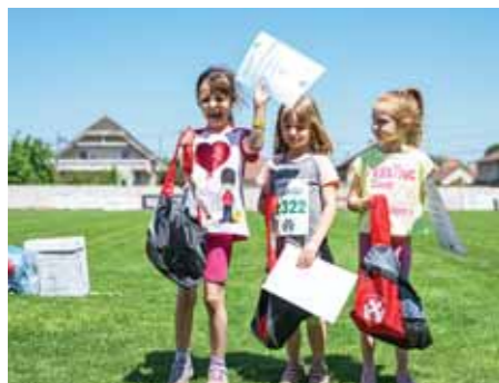
Az öröm pillanatai

A műsorvezető, Ali kitűnően, minden részletre kiterjedően, nagy empátiával közvetítette a többórás műsorfolyamot. A rendezők kiválóan dolgoztak, szervezeten, gördülékenyen ment a verseny. A rendezvény biztonságát szolgálta a rendőrség, a polgárőrség és a mentőszolgálat. A nagy meleg és a több száz jelen-