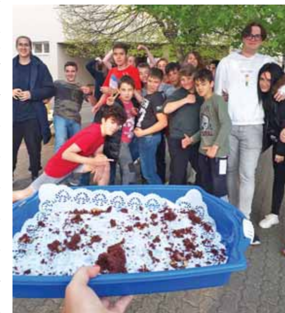
Jó hangulatban telt a nap

Ezen a héten a feldolgozott témák mellett iskolánk több közösségi programban is részt