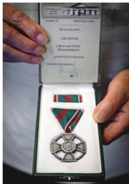
A Magyar Ezüst Érdemkereszt

hosszú pályája során. Elárulta, hatodikos korában kifűrészelte Európa összes államát, a darabokból pedig a puzzle-hoz hasonló kirakót készített. Most ugyanezt tervezi Vecsésel kapcsolatban is, hogy az így elkészített kirakós segítségével a fiatalok játszva ismerjék meg a települést.