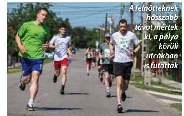
A felnőtteknek hosszabb távot mértek ki, a pálya körüli utcákban is futottak

lekedési tanpályát épített, volt országúti kerékpárszimulátor és egyéb játékok a Decathlon Áruház jóvoltából; és előjegyzéssel élvezhették a helikopter szimulátort, holdjárót, kisvasutat, két hatalmas ugrálóvárat és használhattak számos egyéb alkalmazást. A Williams Televízió LED-falás autóján az elmúlt Lóti-