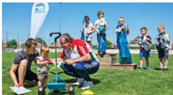
A legfiatalabb versenyző elégedetten vizsgálta nyereményét. Ezért is megérte futni egy kicsit

A köztes idő hasznos eltöltését sok minden szolgálta. Az ITM Kulturált Közlekedésért Alapítványa kerékpáros köz-