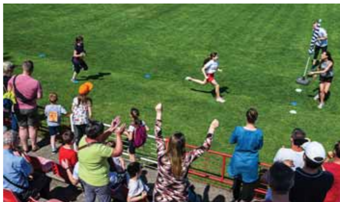
Az utolsó métereken volt a legnagyobb szükség a biztatásra

lévő ellenére különös esemény nem történt.