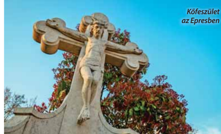
Kőfeszület az Egresben