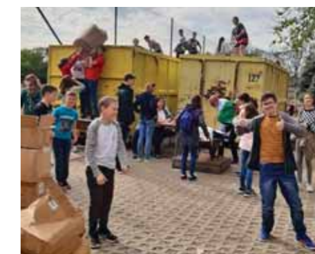
Több mint 14 tonna papírt gyűjtöttek össze a diákok

vett a fenntarthatósági témahét keretében. Sor került a többek között a sulizsák gyűjtésre. Az idei tanévben 1544 kg ruhát sikerült összegyűjtenünk. Április 28-ára papírgyűjtést szerveztünk. A gyűjtés és a konténerpakolás is remek hangulatban telt. Kiváló eredményt