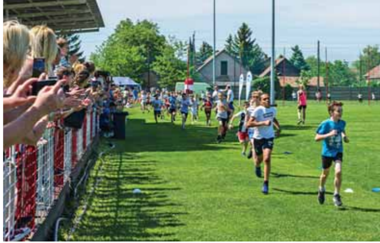
A hőség ellenére is sokan futottak a vecsési sportpályán és a környező utcákban