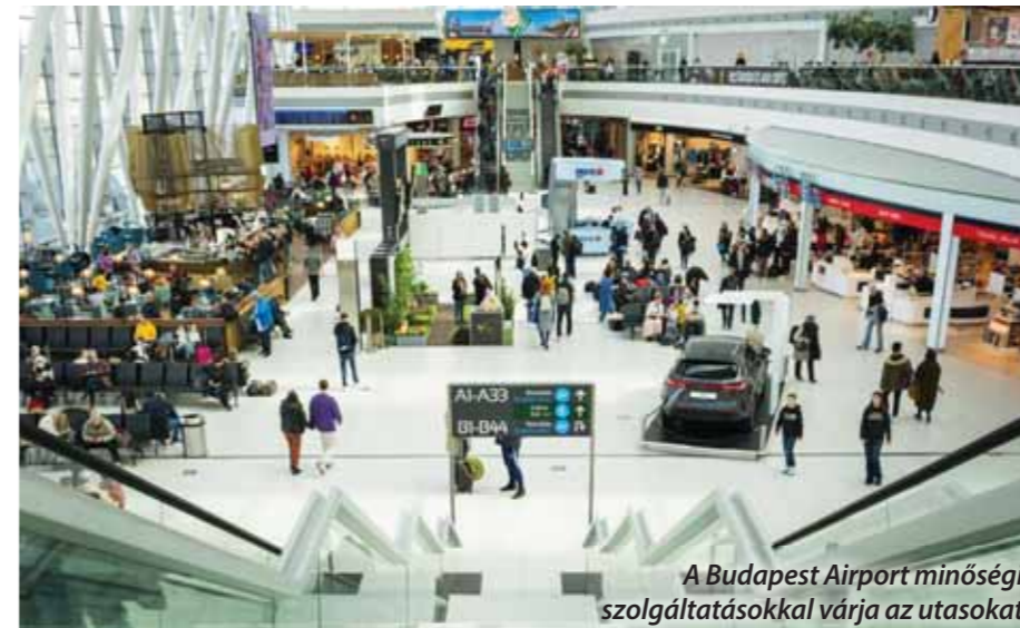
A Budapest Airport minőségi szolgáltatásokkal várja az utasokat

Nyáron mindannyian vágyunk a kikapcsolódásra, a napsütésre és a felejthetetlen élményekre. A Liszt Ferenc Nemzetközi Repülőtérrel a 2022-es nyári szezonban 122 desztináció és 112 város érhető el közvetlenül 35 légitársaság járataival. A Budapest Airport mindent megtesz, hogy minőségi szolgáltatásainak köszönhetően elégedetten és stresszmentesen indulhassanak és érkezhessenek az utasok.