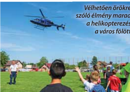
Vélhetően örökreszózó élmény marad a helikopterezés a város fölött