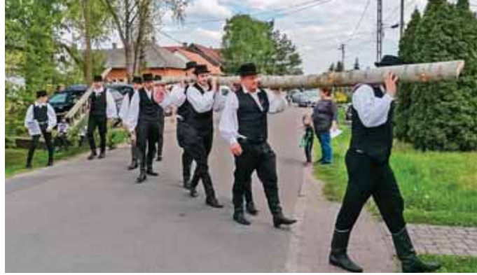
A férfiak együtt vitték a vállukon a májusfát a tájház udvarára