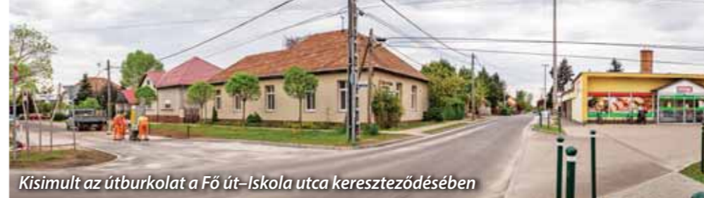
Kisimult az útburkolat a Fő út–Iskola utca kereszteződésében

gatom a fellépést is, sőt a múltkor már majdnem is adódott erre lehetőség – sajnos az utolsó pillanatban lemondta. Korábban, még a jelenlegi Bálint Ágnes Kulturális Központ felépülése előtt a gyermekkönyvtárban volt olyan irodalmi kör, ahol tartottam a gyermekeknek előadást, és persze a közösségi kapcsolódás fontos számomra. Práczki Péter