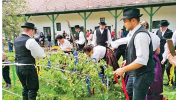
A díszítés már a lányokkal és a vendégekkel közösen történt