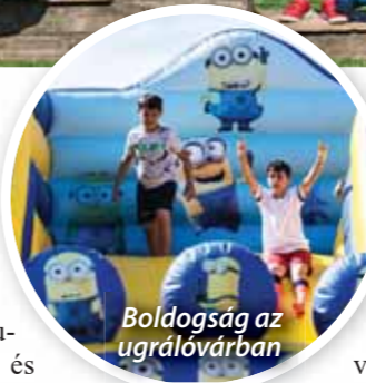
Boldogság az ugrálóvárban

lekedési tanpályát épített, volt országúti kerékpárszimulátor és egyéb játékok a Decathlon Áruház jóvoltából; és előjegyzéssel élvezhették a helikopter szimulátort, holdjárót, kisvasutat, két hatalmas ugrálóvárat és használhattak számos egyéb alkalmazást. A Williams Televízió LED-falás autóján az elmúlt Lóti-