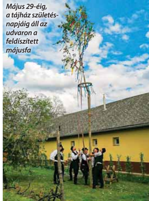
Május 29-éig, a tájház születésnapjáig áll az udvaron a feldíszített májusfa

A májusfa úgynevezett „kitáncolását” május 29-én, a Tájház születésnapján tartják majd. www.vecses.hu , fényképek: Szappanos Krisztina