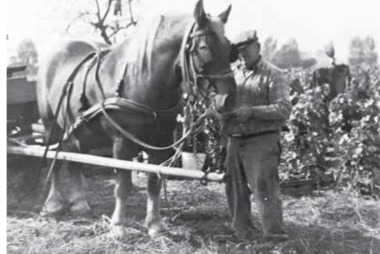
Édesapám a kedves lovával, amíg megvolt

Édesapám 1946 decemberében jött haza a fogságból, én 1947 novemberében születtem kései gyermekként, szüleim öröme. Életünket a Rákosi-rendszer keserítette meg a köte-